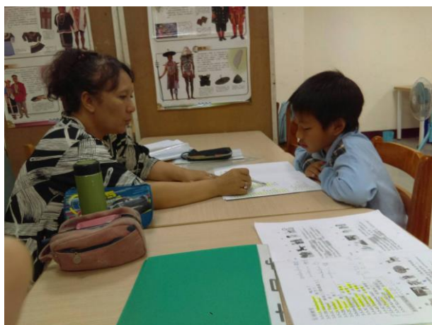
活動照片 7：上課內容:第三階 1-5 課