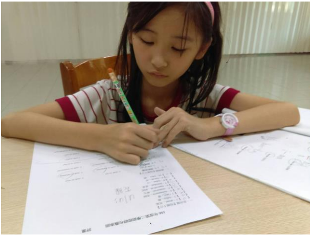
活動照片 9：上課內容:第一階 1-5 課