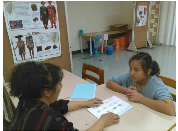
活動照片 10：上課內容:第一階 5-10 課