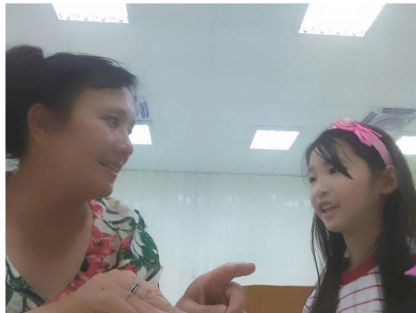
活動照片 2：聽力測驗