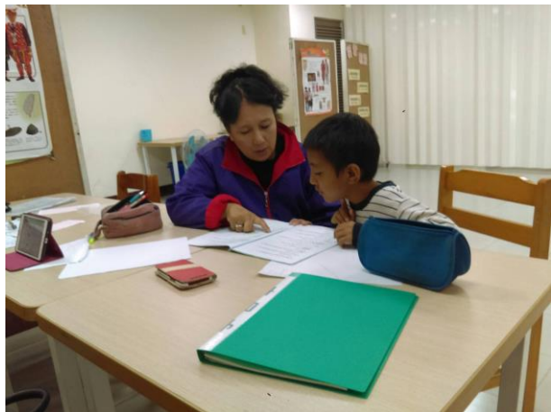
活動照片 1：課文詞彙