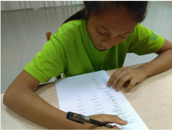
活動照片 17：上課內容:第一階 1-5 課