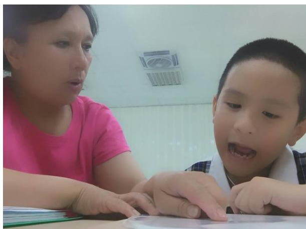
活動照片 13：上課內容:第一階 1-5 課