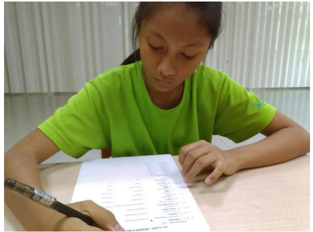
活動照片 18：上課內容:第一階 5-10 課