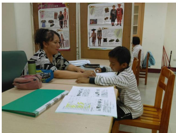
活動照片 5：上課內容:第一階 1-5 課