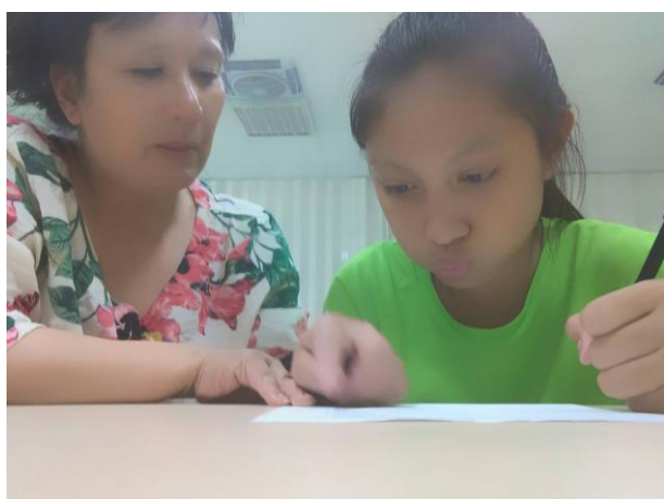
活動照片 15：上課內容:第二階 1-5 課