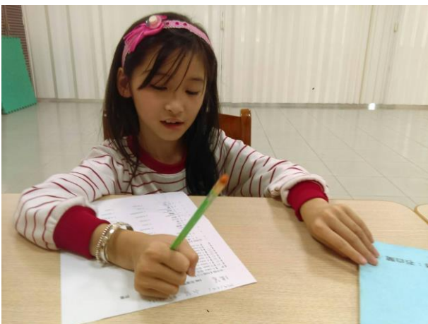
活動照片 11：上課內容:第二階 1-5 課