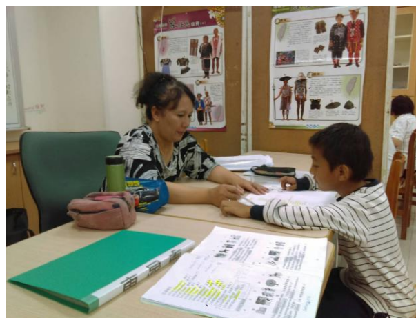
活動照片 6：上課內容:第一階 5-10 課