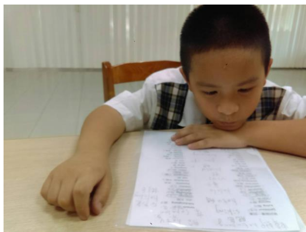
活動照片 14：上課內容:第一階 5-10 課