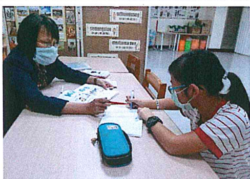
活動照片 3：口說、手寫。