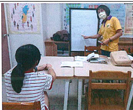
活動照片 5：詞句介紹。