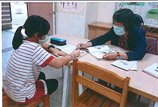
活動照片 2：請你跟我這樣說。