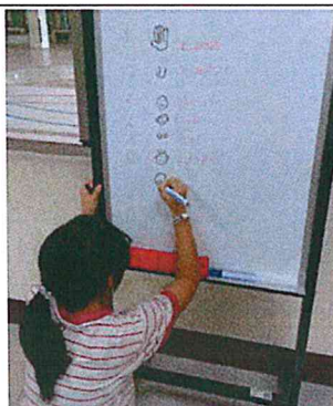
活動照片 4：我「繪」西拉雅語。