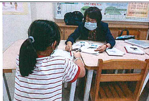
活動照片 1：Masusu-a.我問你答。