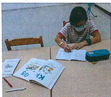
活動照片 7：造句練習。